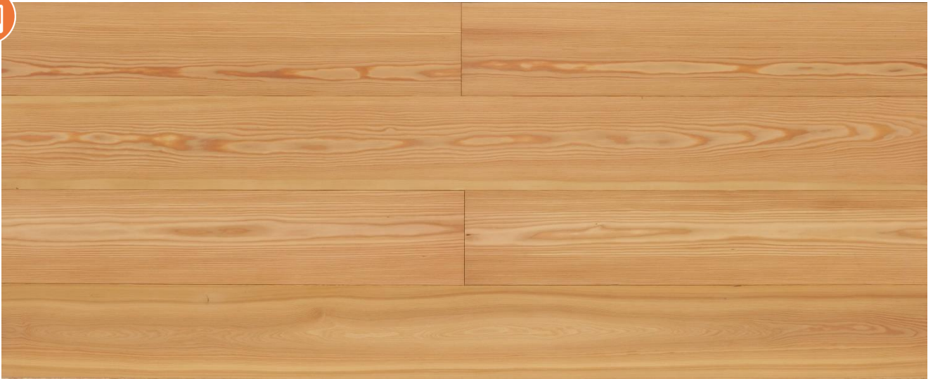
Lärche sibirisch A