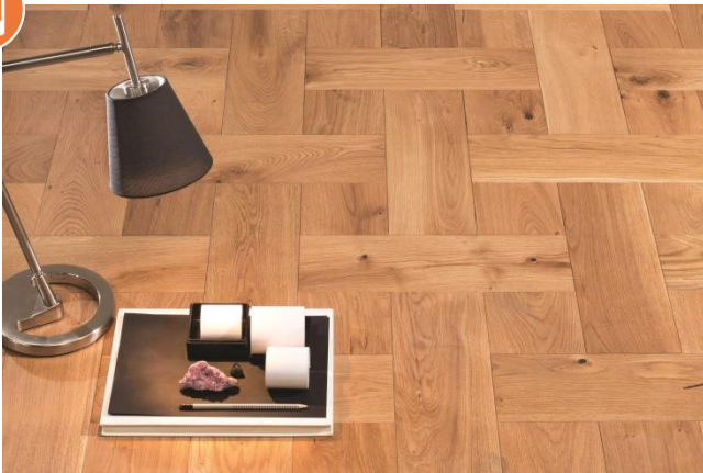
Eiche Eleganz/Natur Knopf II

Das Naturprodukt Holz ist einzigartig in seiner Form und Beschaffenheit. Struktur- und Farbunterschiede unterstreichen seine Individualität und stellen keinen Mangel dar. Mit unserer langjährigen Erfahrung und der Liebe zum Holz sind wir stets bestrebt Ihnen ein einwandfreies Produkt zu liefern. Gänzlich können wir vereinzelte Sortier- und Produktionsfehler nicht ausschließen, welche jedoch 5% der Liefermenge nicht überschreiten.