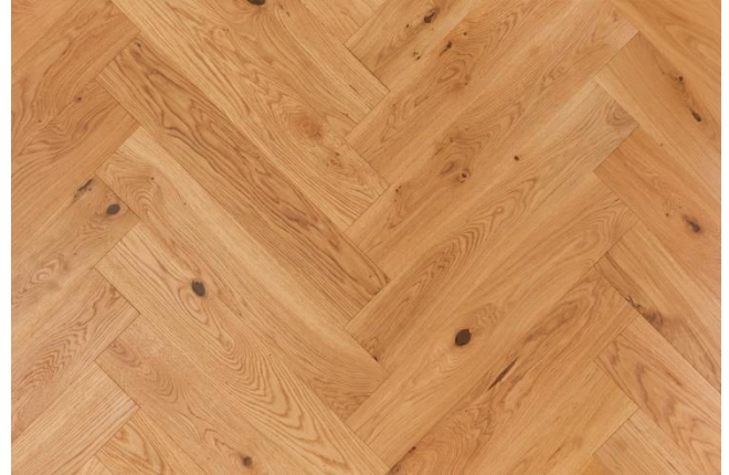
Eiche Markant (Abbildung 90°)

Das Naturprodukt Holz ist einzigartig in seiner Form und Beschaffenheit. Struktur- und Farbunterschiede unterstreichen seine Individualität und stellen keinen Mangel dar. Mit unserer langjährigen Erfahrung und der Liebe zum Holz sind wir stets bestrebt Ihnen ein einwandfreies Produkt zu liefern. Gänzlich können wir vereinzelte Sortier- und Produktionsfehler nicht ausschließen, welche