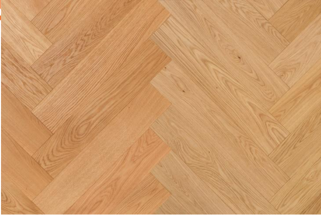
Eiche Eleganz-Natur (Abbildung 90°)