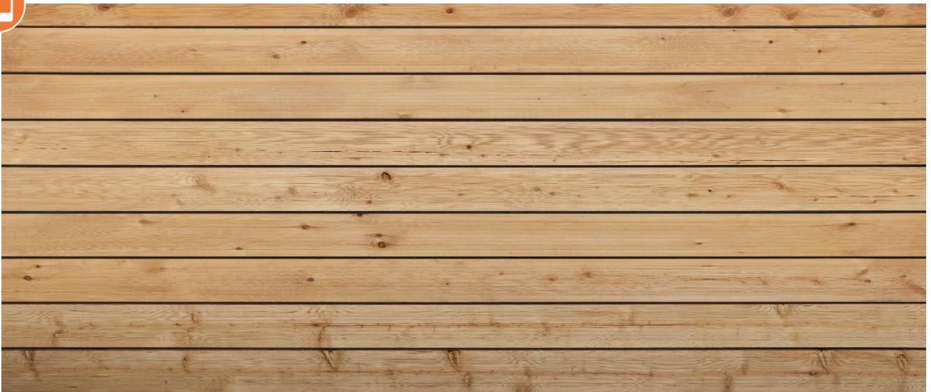
Lärche sibirisch gerillt