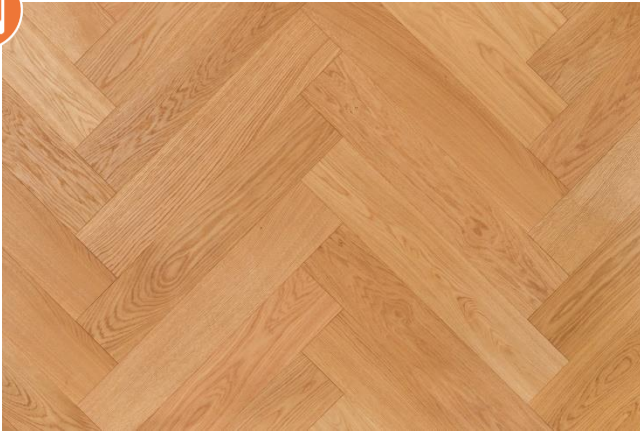
Eiche Eleganz (Abbildung 90°)