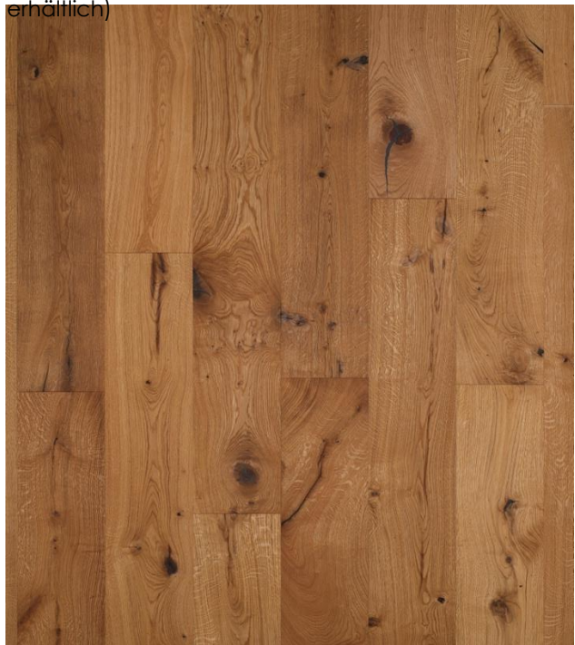
Eiche Country WILD

Das Naturprodukt Holz ist einzigartig in seiner Form und Beschaffenheit. Struktur- und Farbunterschiede unterstreichen seine Individualität und stellen keinen Mangel dar. Mit unserer langjährigen Erfahrung und der Liebe zum Holz sind wir stets bestrebt Ihnen ein einwandfreies Produkt zu liefern. Gänzlich können wir vereinzelte Sortier- und Produktionsfehler nicht ausschließen,