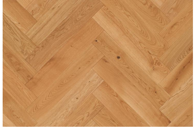
Eiche Natur (Abbildung 90°)