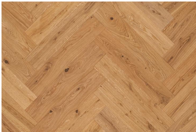
Eiche Markant (Abbildung 90°)