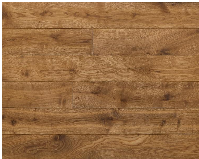
Eiche angeräuchert Natur