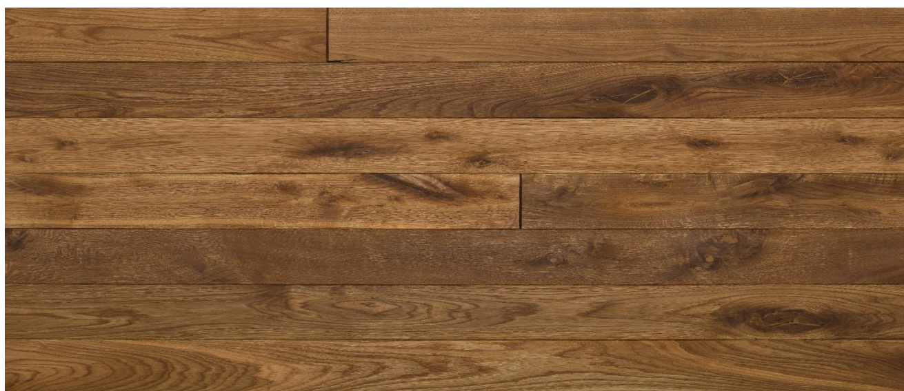
Eiche angeräuchert Markant

Das Naturprodukt Holz ist einzigartig in seiner Form und Beschaffenheit. Struktur- und Farbunterschiede unterstreichen seine Individualität und stellen keinen Mangel dar. Mit unserer langjährigen Erfahrung und der Liebe zum Holz sind wir stets bestrebt Ihnen ein einwandfreies Produkt zu liefern. Gänzlich können wir vereinzelte Sortier- und Produktionsfehler nicht ausschließen, welche jedoch 5% der Liefermenge nicht überschreiten.