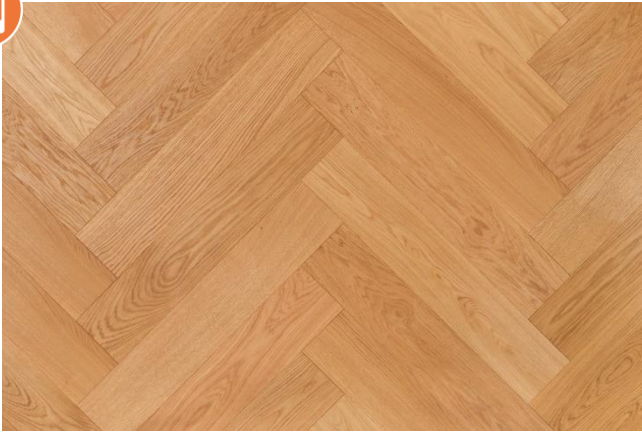
Eiche Eleganz (Abbildung 90°)