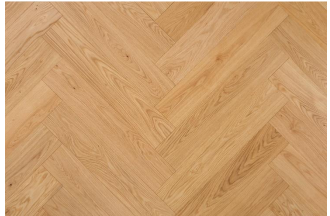
Eiche Natur (Abbildung 90°)