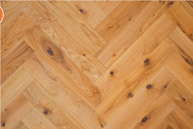
Eiche Markant Abbildung 90°