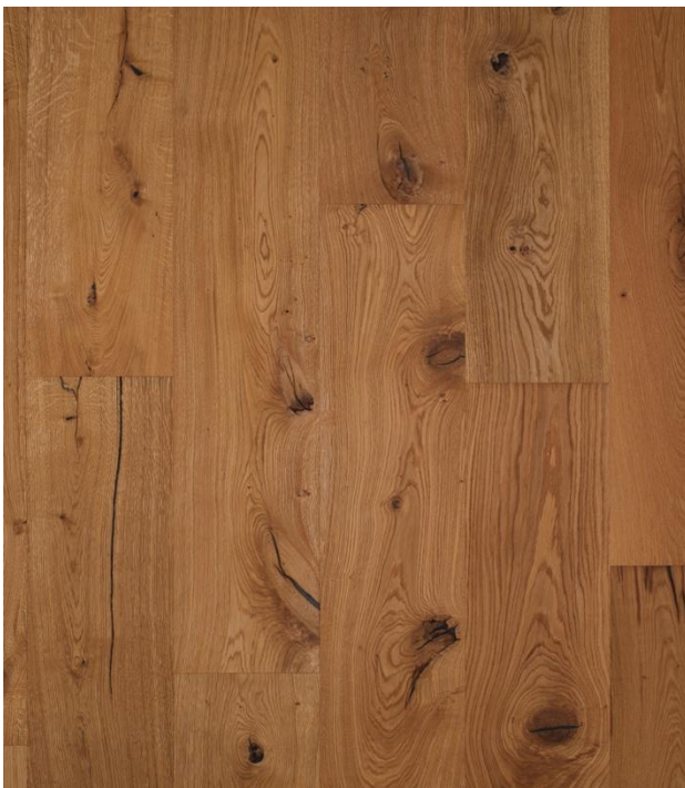
Eiche Country L / XL