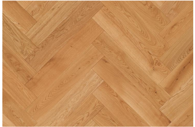
Eiche Natur (Abbildung 90°)