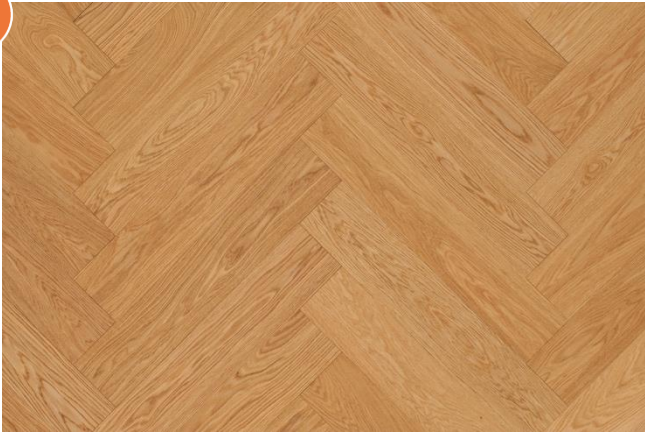
Eiche Eleganz (Abbildung 90°)