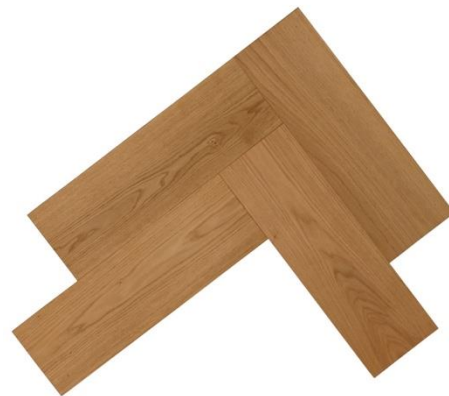
Fischgrät Winkel 90°

Das Naturprodukt Holz ist einzigartig in seiner Form und Beschaffenheit. Struktur- und Farbunterschiede unterstreichen seine Individualität und stellen keinen Mangel dar. Mit unserer langjährigen Erfahrung und der Liebe zum Holz sind wir stets bestrebt Ihnen ein einwandfreies Produkt zu liefern. Gänzlich können wir vereinzelte Sortier- und Produktionsfehler nicht ausschließen, welche