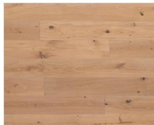
White 5% R331a endgeölt