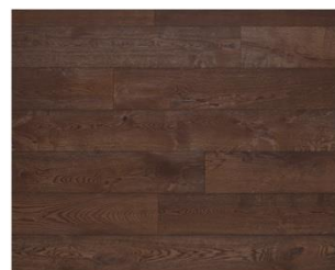
Chocolate R306 endgeölt