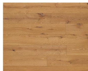
Smoked Oak R209 endgeölt