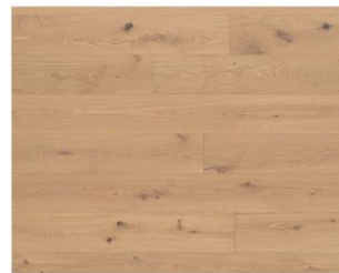
Neutral R2020 endgeölt (Rohholzoptik gebeizt & geölt)