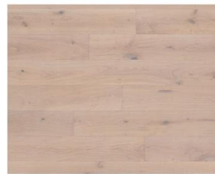
White R331 endgeölt