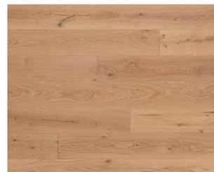
Crudo R920 endgeölt