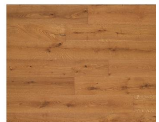
Bernstein R2021 endgeölt (gebeizt & geölt)