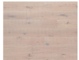
Super White R328 endgeölt