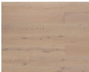
Cornsilk R334 endgeölt