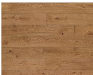
Castle Brown R201 endgeölt