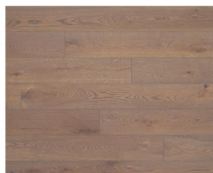
Havanna R311 endgeölt