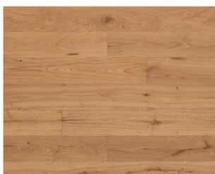
Champagne R331a+R333 endgeölt