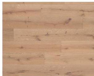
Smoke 5% R326a endgeölt