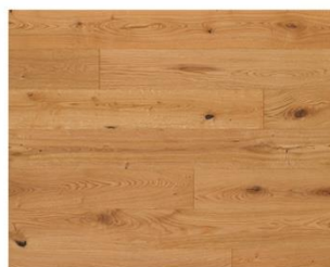
Pure R101 endgeölt