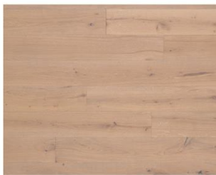
Natural R315 endgeölt