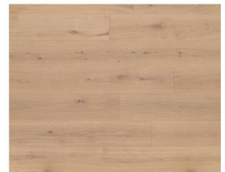
Vanilla R330 endgeölt