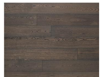
Charcoal R305 endgeölt

Bedingt durch die Rohholzbeize könne bei der Oberfläche Neutral R2020 leichte Farbunterschiede vorkommen.