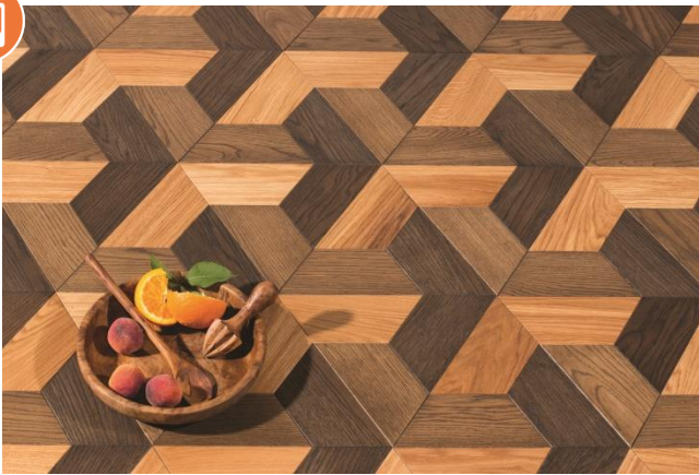
Eiche Eleganz/Natur Karree