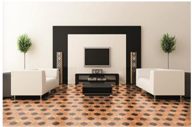
Eiche Eleganz/Natur Karree II

Das Naturprodukt Holz ist einzigartig in seiner Form und Beschaffenheit. Struktur- und Farbunterschiede unterstreichen seine Individualität und stellen keinen Mangel dar. Mit unserer langjährigen Erfahrung und der Liebe zum Holz sind wir stets bestrebt Ihnen ein einwandfreies Produkt zu liefern. Gänzlich können wir vereinzelte Sortier- und Produktionsfehler nicht ausschließen, welche jedoch 5% der Liefermenge nicht überschreiten.