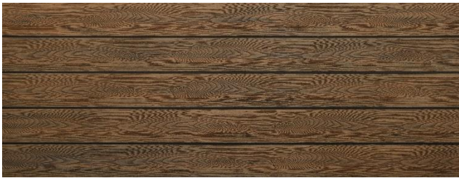
Thermoeiche (Optik) struktur