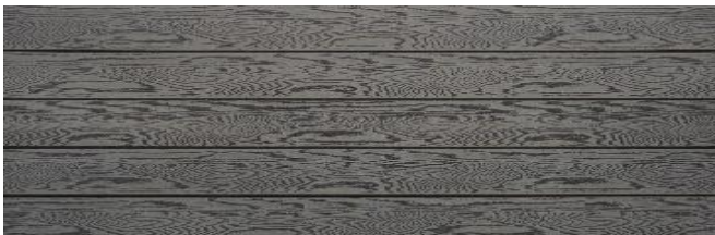
Hellgrau massiv struktur