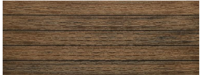
Thermoeiche (Optik) gebürstet