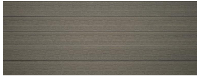
Thermolärche (Optik) gebürstet