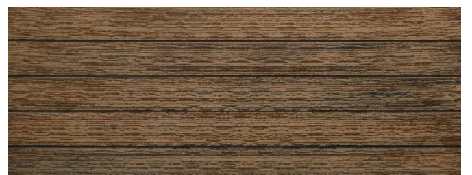
Thermoeiche (Optik) gebürstet