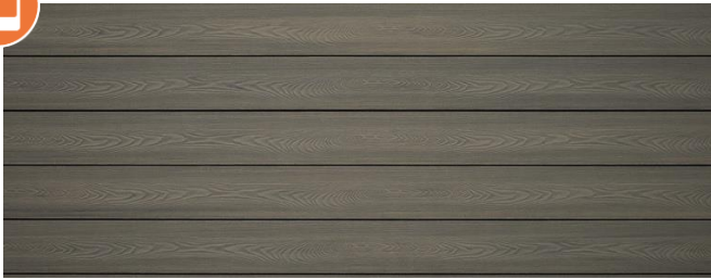
Thermolärche (Optik) struktur