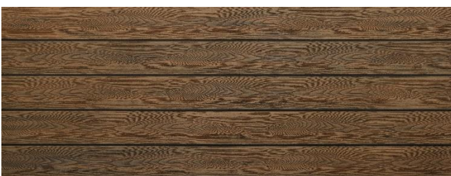
Thermoeiche (Optik) struktur