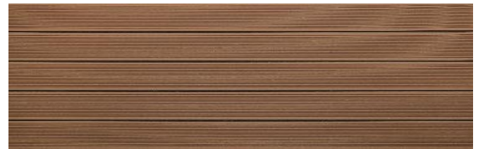
Hellbraun massiv gerillt