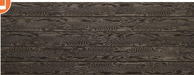
Thermoesche (Optik) struktur