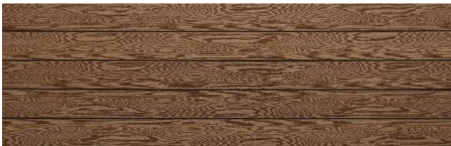
Hellbraun massiv struktur