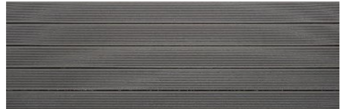
Hellgrau massiv gerillt