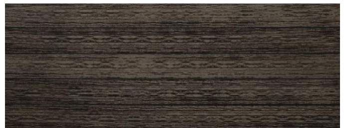
Thermoesche (Optik) gebürstet