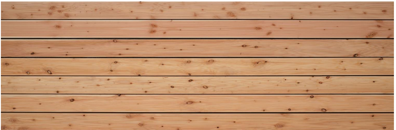
Lärche europäisch A/B gerillt