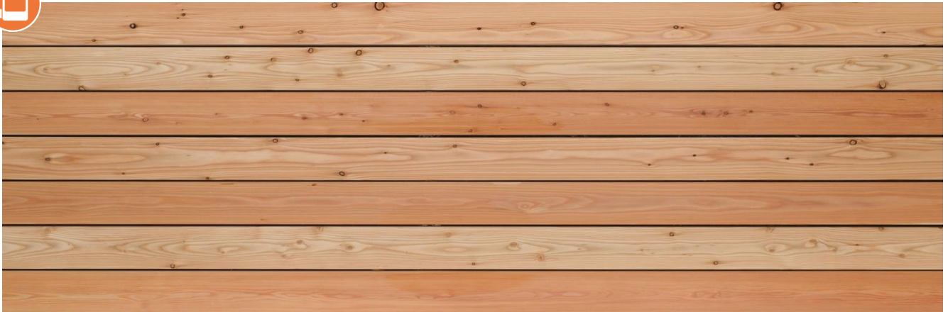
Lärche europäisch A/B glatt