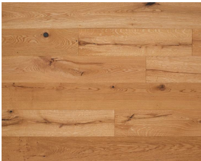
Eiche Country LIFE