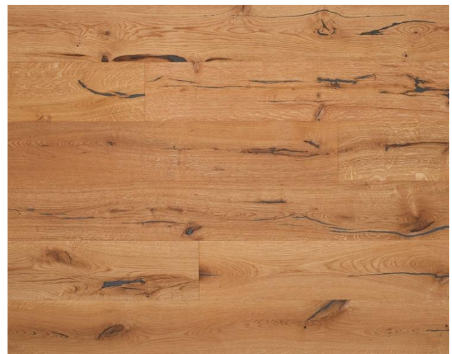
Eiche Country WILD

Das Naturprodukt Holz ist einzigartig in seiner Form und Beschaffenheit. Struktur- und Farbunterschiede unterstreichen seine Individualität und stellen keinen Mangel dar. Mit unserer langjährigen Erfahrung und der Liebe zum Holz sind wir stets bestrebt Ihnen ein einwandfreies Produkt zu liefern. Gänzlich können wir vereinzelt Sortier- und Produktionsfehler nicht ausschließen,