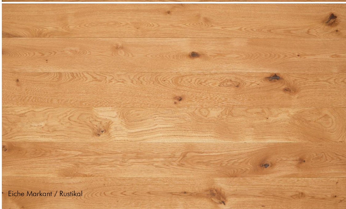
Eiche Markant / Rustikal

Das Naturprodukt Holz ist einzigartig in seiner Form und Beschaffenheit. Struktur- und Farbunterschiede unterstreichen seine Individualität und stellen keinen Mangel dar. Mit unserer langjährigen Erfahrung und der Liebe zum Holz sind wir stets bestrebt Ihnen ein einwandfreies Produkt zu liefern. Gänzlich können wir vereinzelte Sortier- und Produktionsfehler nicht ausschließen, welche jedoch 5% der Liefermenge nicht überschreiten.